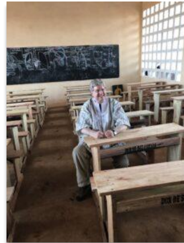
De solides tables-bancs fabriqués par SET dans une salle de classe construite par SET où les élèves du primaire continueront de bénéficier du soutien complet de SET en enseignants

Au cours des cinq prochaines années, nous espérons voir des progrès significatifs dans le développement des enseignants. Cela signifie étendre notre portée au-delà des enseignants de première année des six écoles choisies pour le projet pilote. Cela nécessitera l'embauche de collègues au Togo pour aider Jean-Paul; allocation de fonds au soutien des enseignants; augmentation du nombre d'ateliers pour les enseignants; et augmentation du soutien des directeurs et du gouvernement togolais envers SET. SET investira des fonds à la réparation de quelques-unes des écoles qui ont subi les effets du temps afin de maintenir le meilleur environnement possible pour aider les enfants à forger un meilleur avenir pour eux-mêmes, leurs communautés et leur pays. Ceci sera l'objectif de SET pour les dix prochaines années.