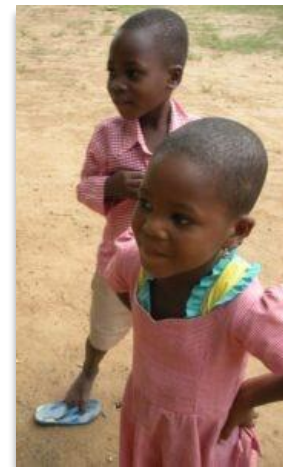
Bientôt en CP1 dans une école SET, les enfants portent l'uniforme vichy des Jardins d'Enfants du Togo

Résultats dans les écoles SET jusqu'à présent? Augmentation de la fréquentation à l'école, en particulier chez les jeunes filles; un corps enseignant plus stable; reconnaissance par le gouvernement togolais des efforts de SET. Pour 15 communautés, les écoles SET ont rendu l'éducation de leurs enfants plus régulière. Mais dans sa vision, SET vise à fournir plus que des briques et du mortier pour l'éducation des élèves du primaire. Plus précisément, l'objectif de SET est de faire en sorte que les enfants du primaire "reçoivent une éducation de qualité qui leur permettra de s'épanouir dans toutes les dimensions de leur vie". Un tel objectif a conduit à se concentrer sur le développement des enseignants.